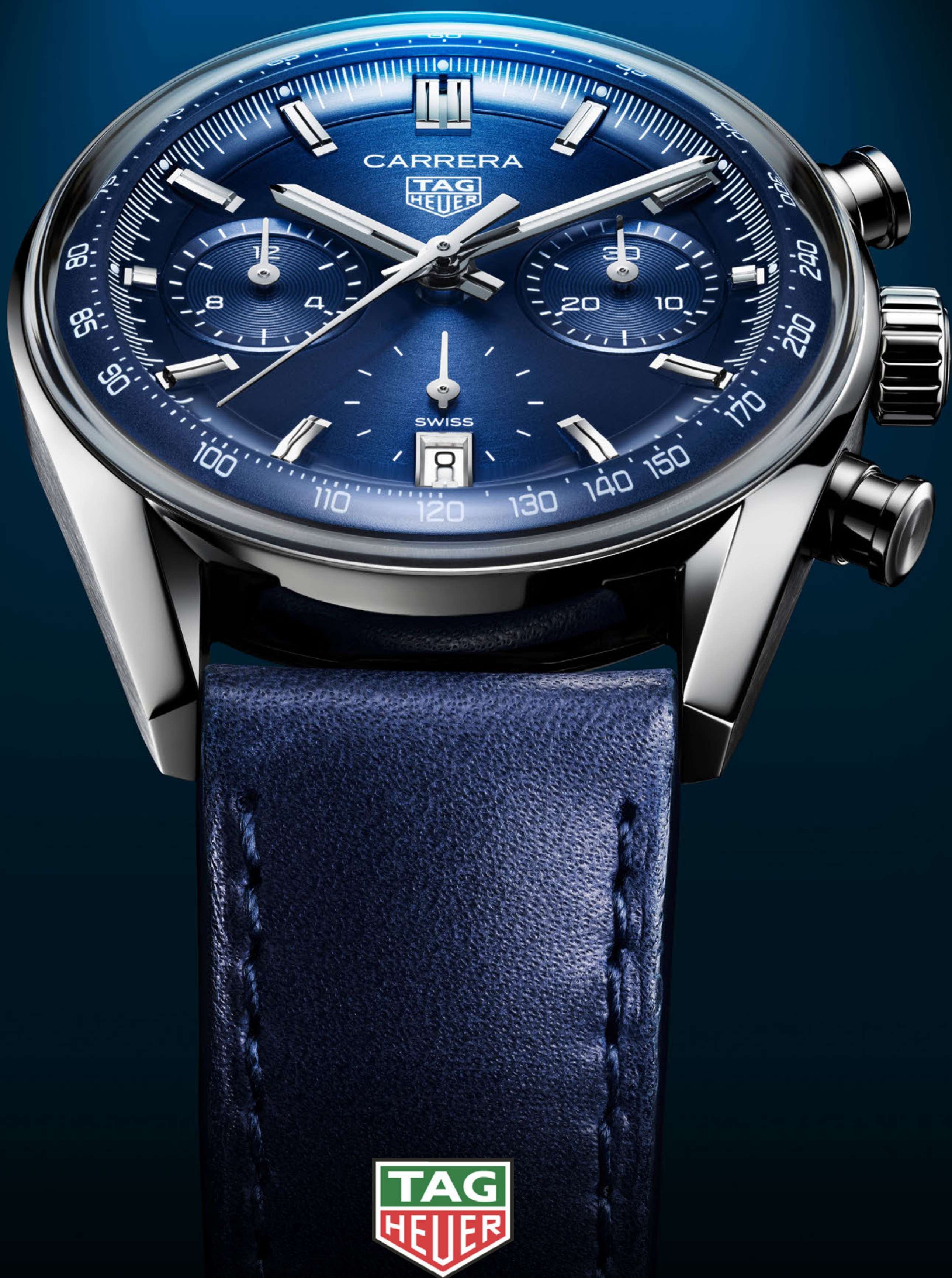
タグ・ホイヤー カレラ クロノグラフ