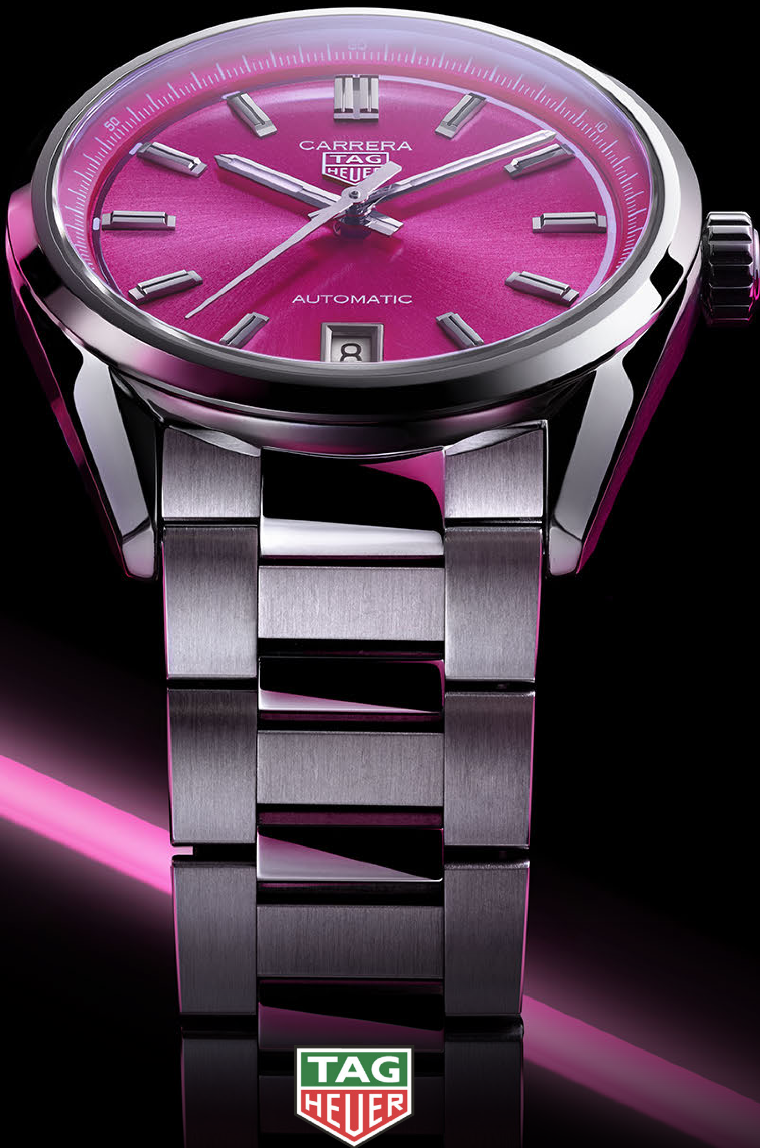
TAG HEUER CARRERA (卡莱拉系列)