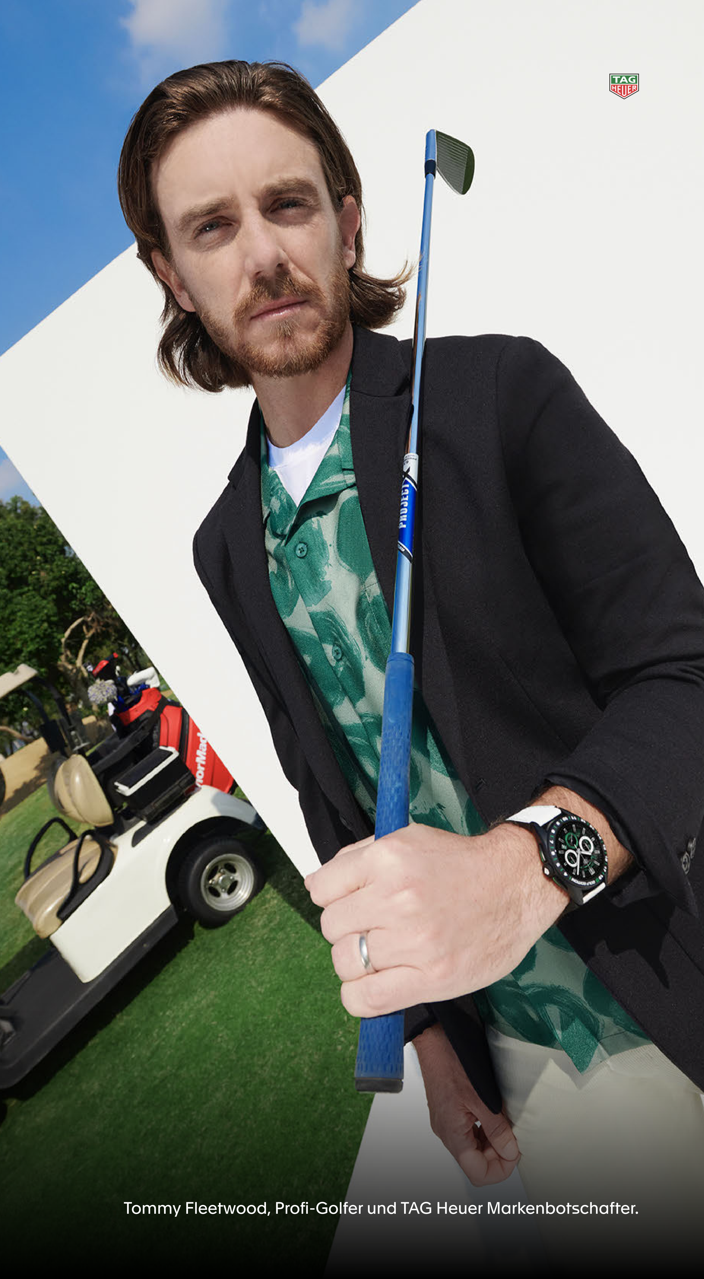
Tommy Fleetwood, Profi-Golfer und TAG Heuer Markenbotschafter.