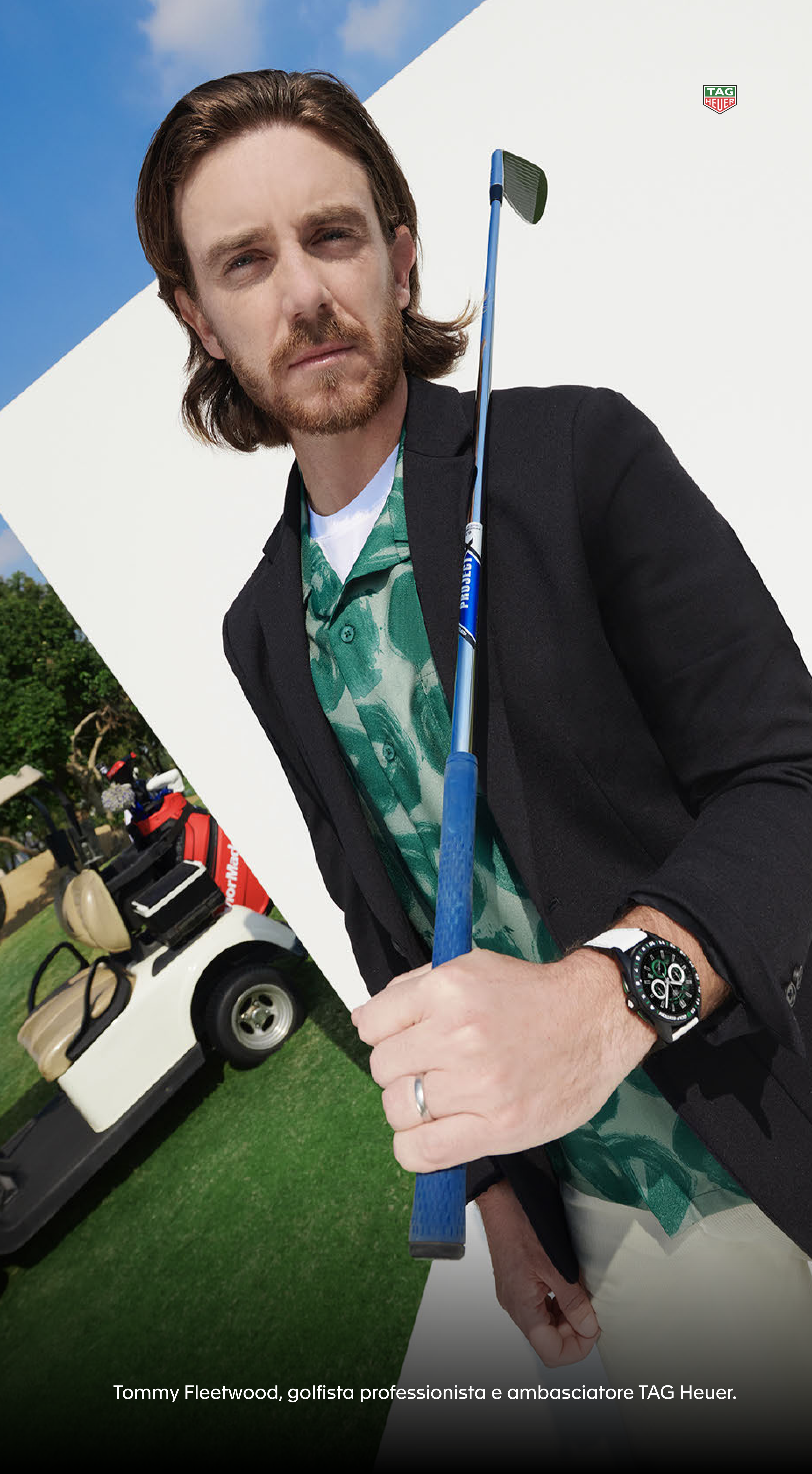
Tommy Fleetwood, golfista professionista e ambasciatore TAG Heuer.